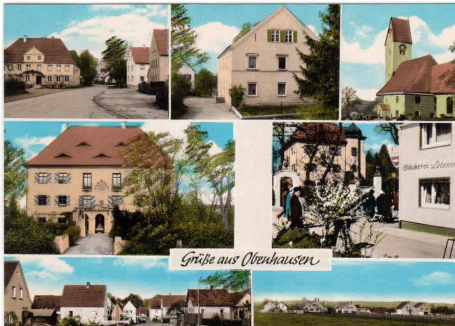
Grüße aus Oberhausen