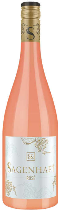
SAGENHAFT ROSÉ 0,2l feinherb

Sommerweide, reife Zitrusfrüchte, Birne, saftiger Schmelz, schöner Trinkfluss 12% Vol.