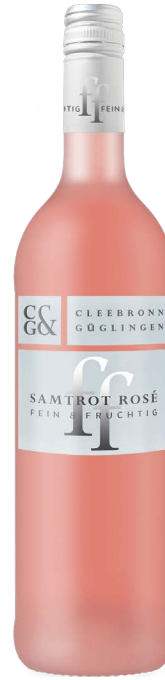
SAMTROT ROSÉ 0,2l fein und fruchtig

Erdbeere, Himbeere, dezente Aprikosennoten, charmante Süße, milde Säure, anhaltende Länge 11% Vol.